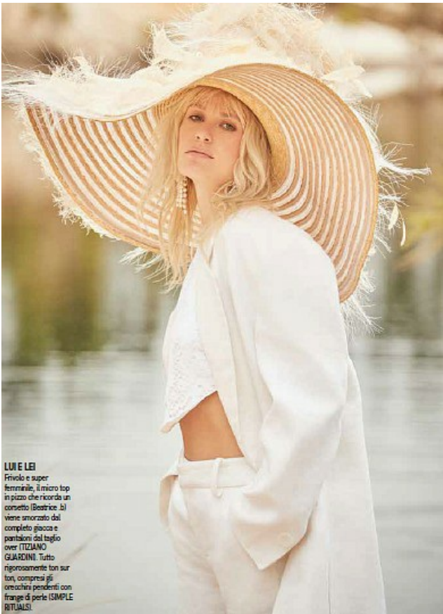
LUI E LEI Frivolo e super femminile, il micro top in pizzo che ricorda un corsetto (Beatrice) si viene ammorzato dal completo giacca e pantaloni dal taglio over (TIZIANO GUARDINI). Tutto rigorosamente ton sur ton, compresi gli orecchini pendenti con frange di perle (SIMPLE RITUALS).