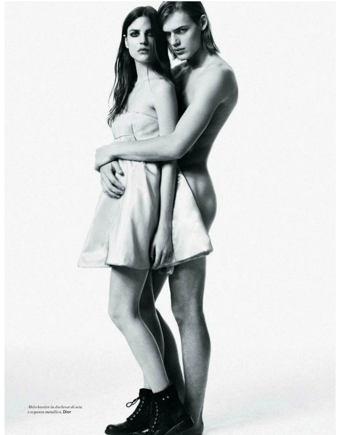
Mito tratter in dolcezza di seta e regina metallica, Dior