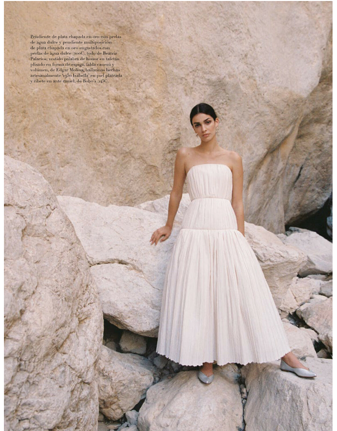
Pendiente de plata chapada en oro con perlas de agua dulce y pendiente multiposición de plata chapada en oro engastados con perlas de agua dulce (200), todo de Beatriz Palacios vestido (palabra de honor en tafetán plisado en forma de espiga, falda caesú y volantes, de Edgar Molino; taconinas hechas artesanalmente 'yfo' 'Isal-lla' en piel plateada y ribete en ante camel, de Bobo's 143).