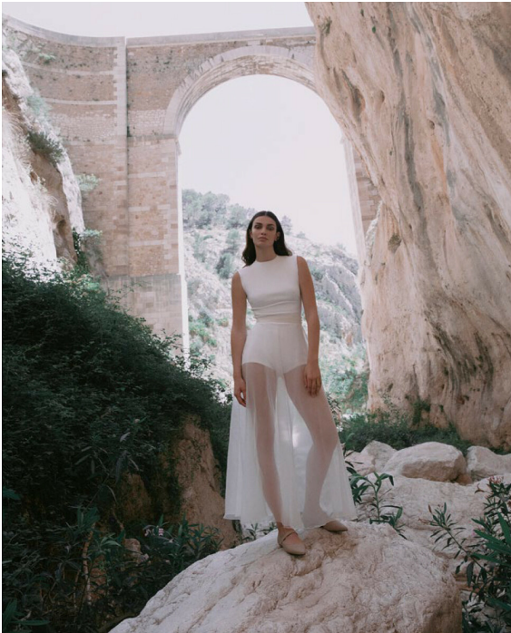
En la página anterior: vestido midí con plisado texturizado de VALENTIA by Valentín Herranz; anillo 'Zoe' en latón con baño de oro, de Glenay Lantigua 796; caps de tul a modo de capelina con cada de la estilista. Sobre estas líneas: pendiente 'Dual' trepador en acero inoxidable con tratamiento PVD oro 18k (146) y anillo 'Éclair' en acero y oro (146), todo de Maram; body de punto en algodón y falda de caps en organza de seda de natural, de De Arroyo; Mary Jane de fabricación artesanal 'Brenta' en lino color topo, de Cassini 796.